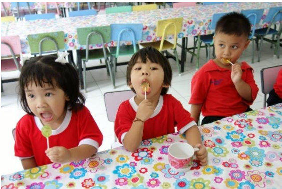
飴をもらってさっそくほおぼっていました

午後はタイへ拠点を構える鹿児島の小正醸造やカルビー社などを訪問し、バンコクで活躍している日系企業のことを学びました。