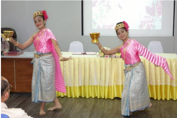
芸能コースの生徒が伝統舞踊を披露しました