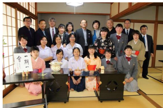
茶道体験での記念写真