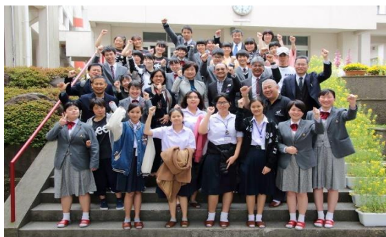
校内での記念写真