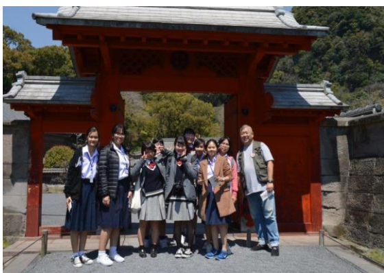
桜島での記念写真

この交流を終え、今後の相互訪問、将来の姉妹校盟約を結ぶ動きに繋がっていきました。