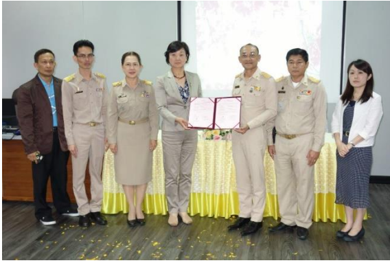
調印式の記念写真