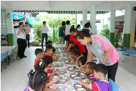
スラム街の保育園での様子

午前中は、スラム街の保育園を訪問しました。日本のお土産の飴を手渡すと目をキラキラと輝かせ、とても嬉しそうにしている姿が印象的でした。